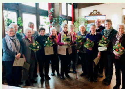
Geehrte Mitglieder der AG Hankensbüttel