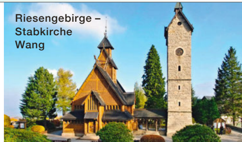
Riesengebirge – Stabkirche Wang